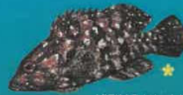
VIEILLE VARECH VIEILLE DE RIVIÈRE Alphesex afer