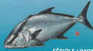
SÉRIOLE LIMON BABIANE Seriola rivoliana