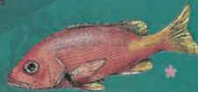
VIVANEAU OREILLES NOIRES BOUCAN-NÈG Lutjanus buccanella