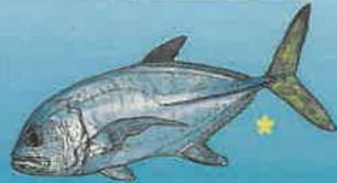
CARANGUE GROS-YEUX MAYOL Caranx lita