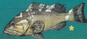
VIEILLE BLANCHE Epinephelus mono