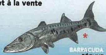
BARRACUDA BÉCUNE Sphyræna barracuda