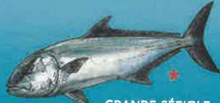
GRANDE SÉRIOLE SÉRIOLE COURONNÉE Seriola lalandi