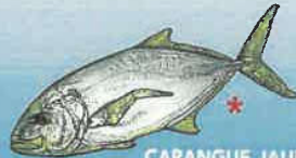
CARANGUE JAUNE Caranx bartholomaei