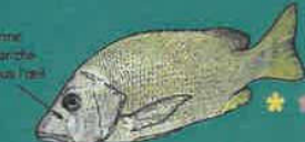
PAGRE DENTS DE CHIEN ZIE PLEURE - PAGRE FINE Lutjanus fovea