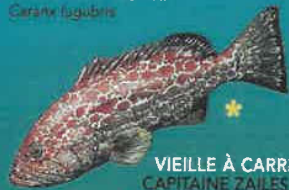
VIEILLE À CARREAUX CAPITAINE ZAILLES JAUNES CAPITAINE ROUGE Myrioperca venenosa